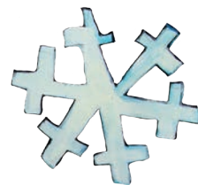
Tiril og Ronja